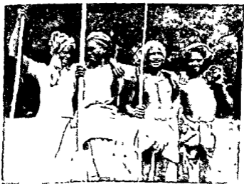
कलके से मूमिहीन आज के किसान